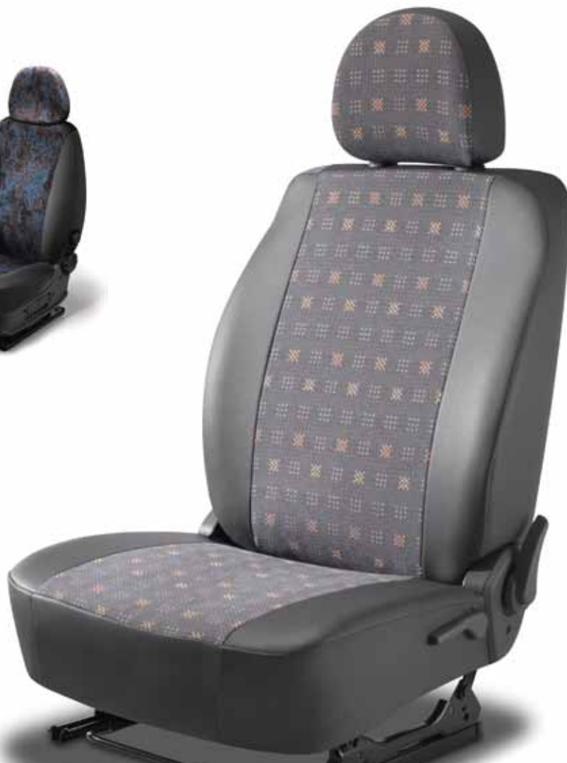
Pokrowce na fotele Vartel